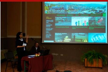
Civil kommunikáció – tanácskozás