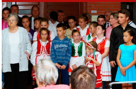
Óradnai diákok voltak vendégeink